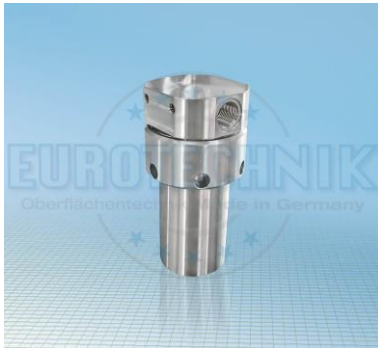
Sieb PN 500 Basisversion