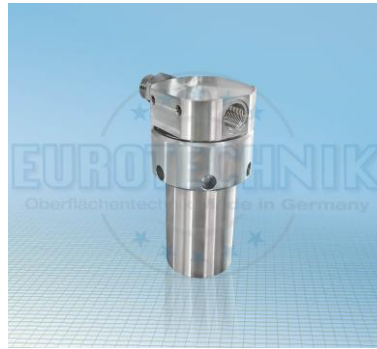
Sieb PN 500 Basisversion zum Pumpenanbau