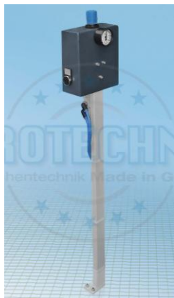
Ausführung 2-Handbedienung (S1)

Tragsäule pulverbeschichtet in RAL 7016 anthrazitgrau Feinstruktur.