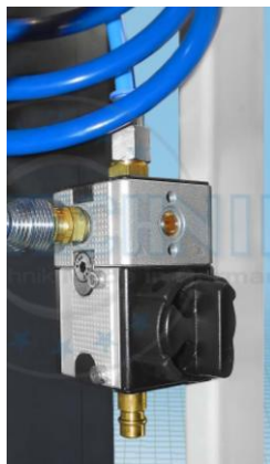
abschließbarer Kugelhahn (S3)